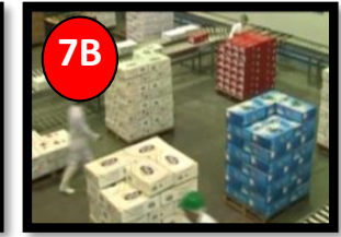
Despacho Pallets & Cajas