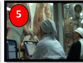
Entrada a Desosado