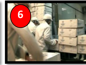
Salida de Desosado