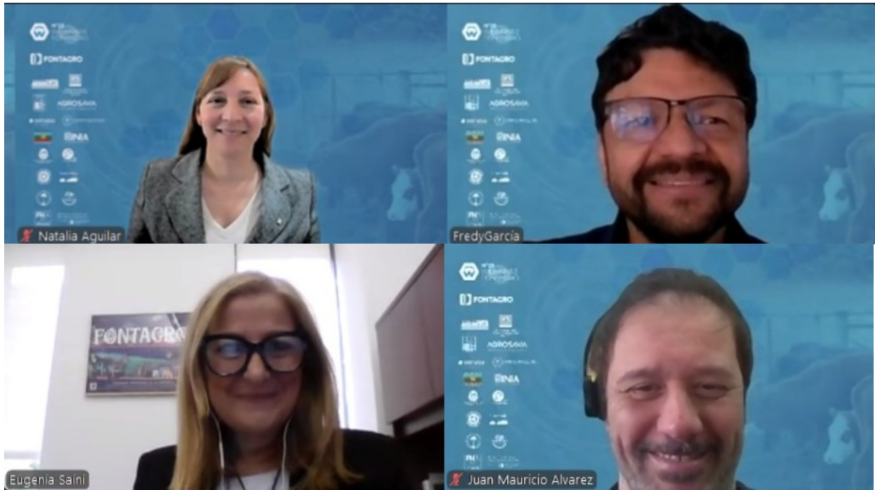
Anexo: Fotografía de los panelistas.