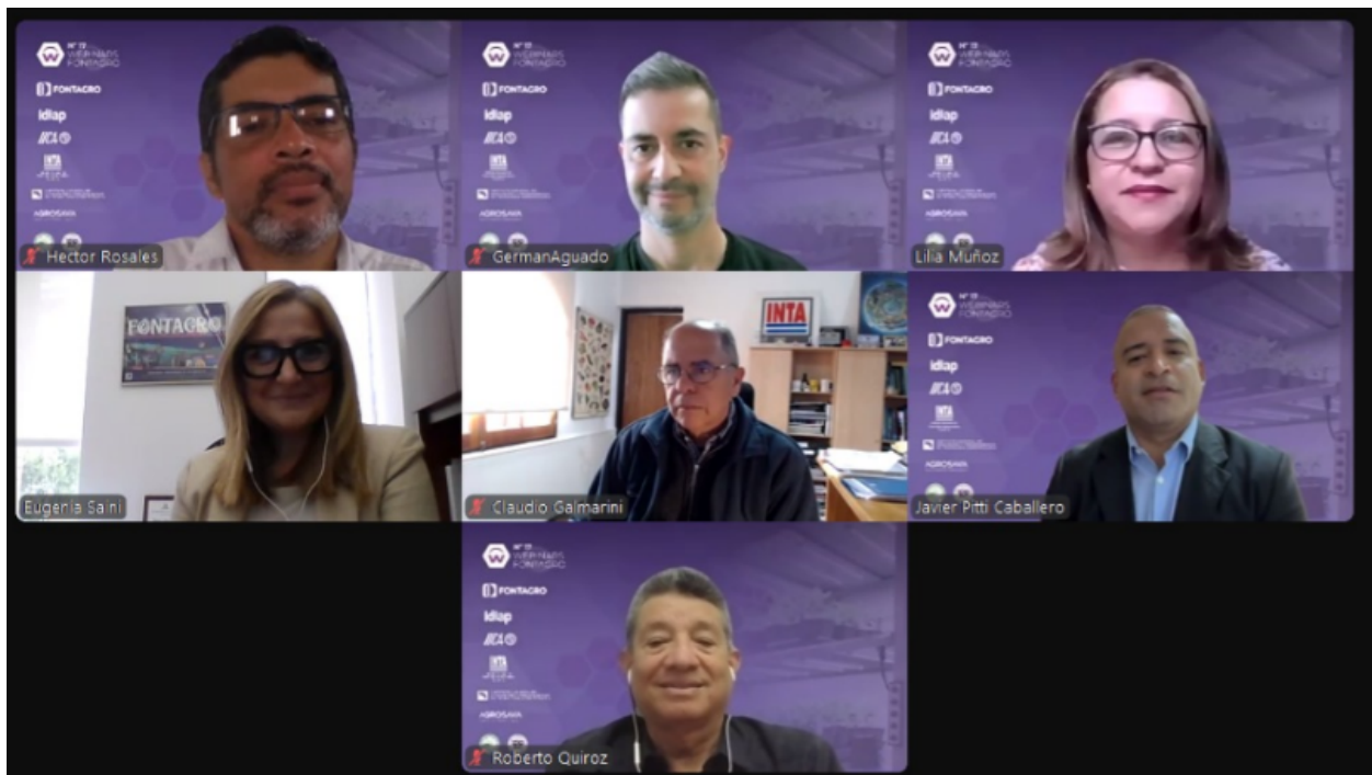
Anexo: Fotografía de los panelistas.