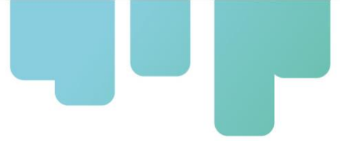
Cuadro 4. Preguntas incluidas en el protocolo de entrevista.