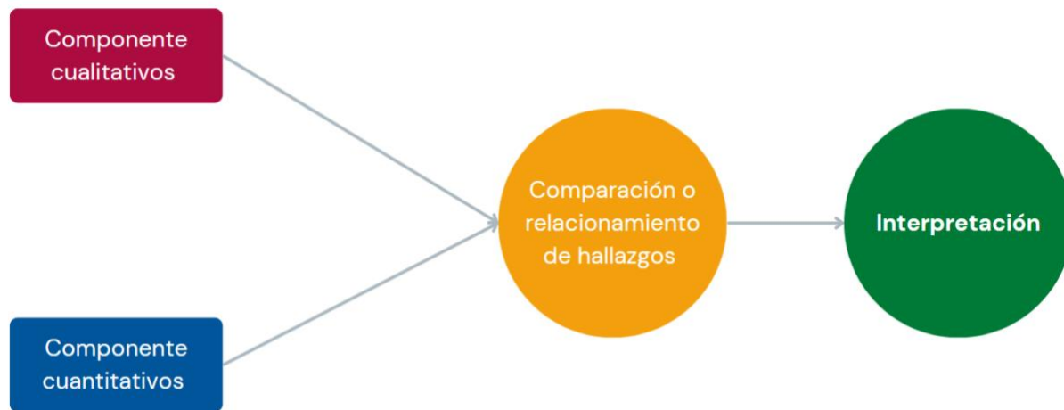
Figura 3. Diseño metodológico aplicado al estudio: mixto convergente paralelo (Creswell, 2014).