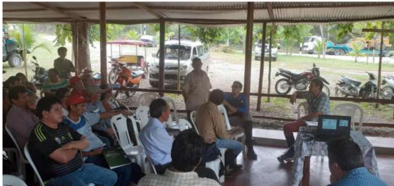
Foto 12: Ronda de preguntas sobre el proyecto por parte de los ganaderos del comité.