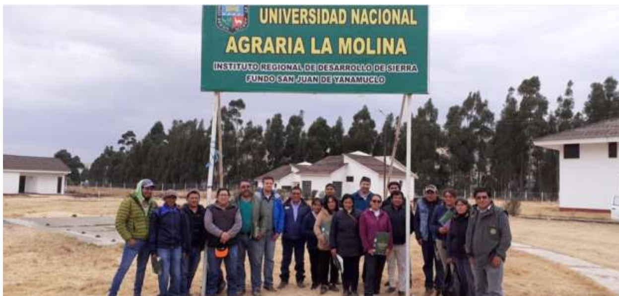
Foto 8: Foto con ganaderos y equipo técnico del proyecto en Perú y Argentina.