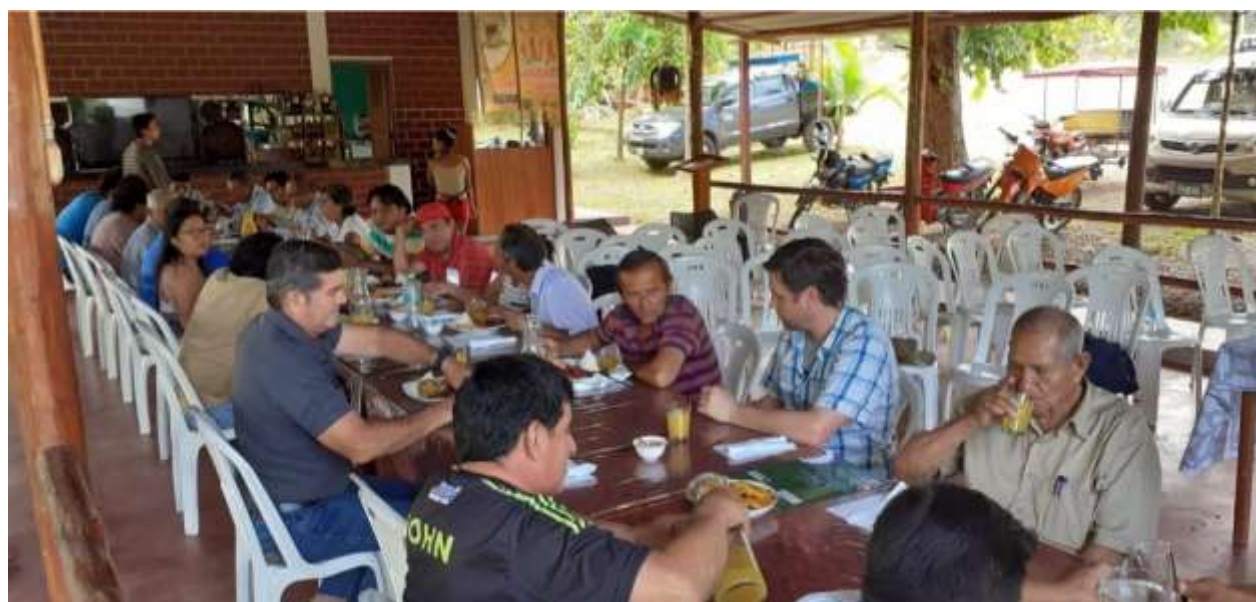
Foto 14: Almuerzo de camaradería luego de la presentación del proyecto.