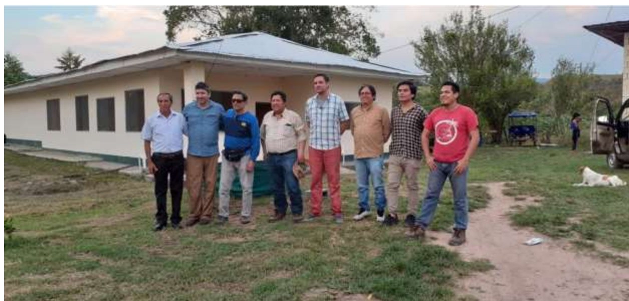
Foto 16: Equipo técnico de Perú y Argentina, del Fundo Pucayacu de la UNALM en la Selva.