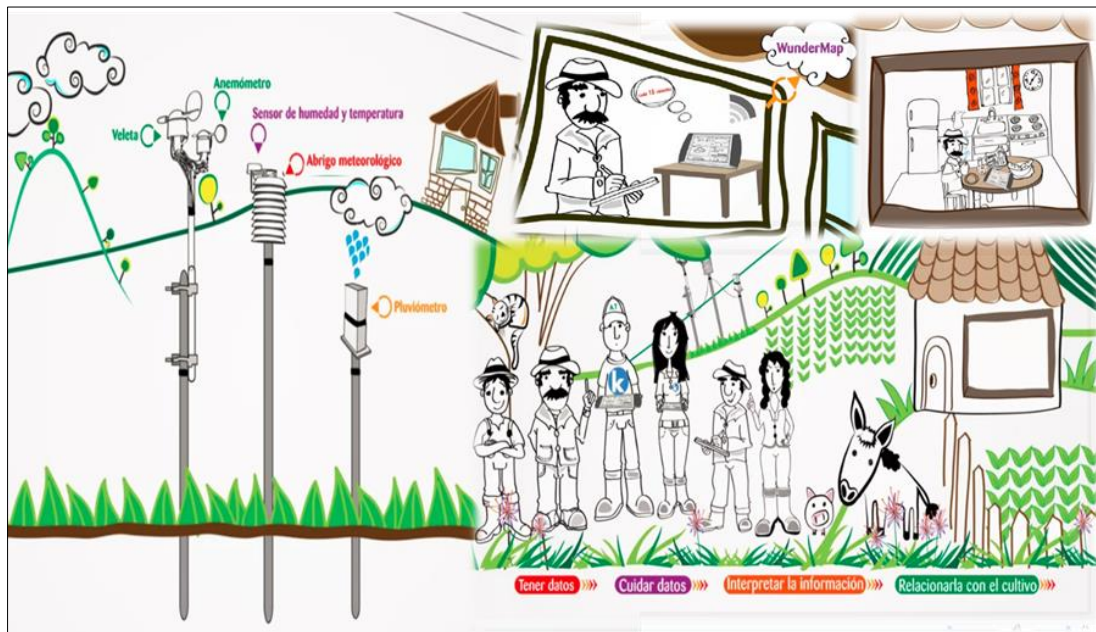
Figura 1. Gestión de información agroclimática.

La gestión de la información agroclimática es un proceso dinámico orientado al manejo adecuado de los datos, desde el registro, transmisión, almacenamiento, procesamiento, control de calidad, visualización, consulta (idealmente en tiempo real) y descarga por el usuario final ( Error! Reference source not found. ). Su objetivo principal es facilitar el acceso a información de calidad para la toma de decisiones y permitir a diferentes actores (agricultores, investigadores y tomadores de decisión, entre otros), identificar y cuantificar los riesgos derivados de la variabilidad climática y eventos extremos en la agricultura, cada vez más frecuentes e intensos.